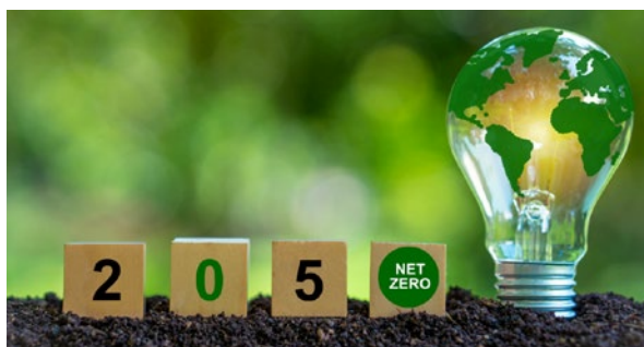
CO 2 排出削減イメージ図

オフィス及び社用車利用に係る CO 2 排出量に対し、業務の合理化・効率化による削減は勿論のこと、再生可能エネルギー由来の電力への切替や HV、EV 化を進める等施策を進め 2030 年までに 2021 年度比 33% 削減、2050 年までに実質ゼロとすることを目指します。