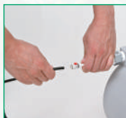
①チューブを差し込みます。