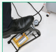
②フットポンプを踏みます。